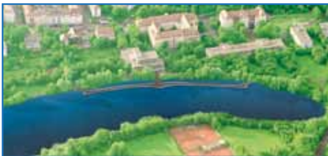
Blick von oben auf Stegverlauf

aus wasserbaulicher Sicht im Wöhrder See zu verbessern, Leitstrukturen unterhalb des Wasserspiegels eingebracht.