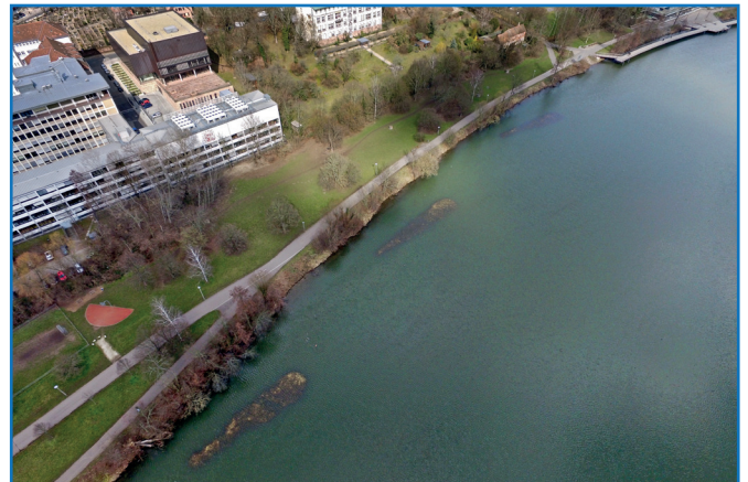
Im Unteren Wöhrder See werden drei Ökoinseln angelegt.