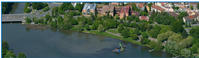
Die Luftaufnahme vom Mai 2013 zeigt den Bereich des zukünftigen Sandstrandes.

Der Untere Wöhrder See besitzt derzeit eine sehr monotone, nicht strukturierte Uferlinie. Die steilen Ufer sind weitgehend nicht zugänglich.